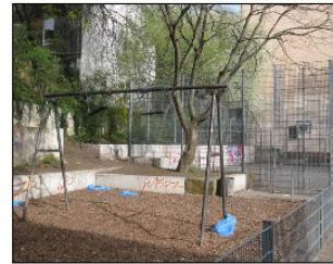
April 2011 (Gerwig)