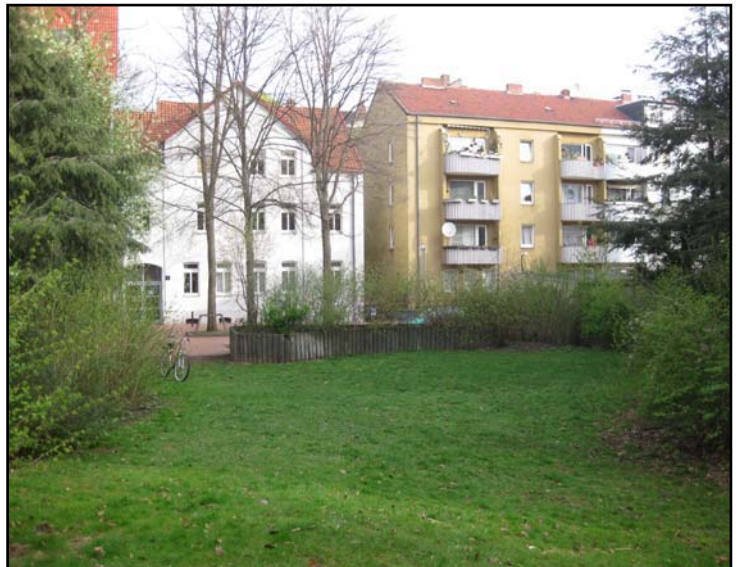
April 2011 (Gerwig)