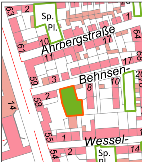
Ausschnitt der Stadtkarte Hannover 1:5000, 2008 Bearbeitung Gerwig