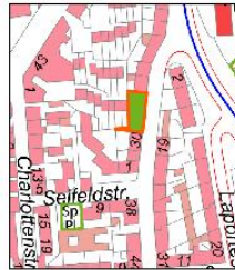
Ausschnitt der Stadtkarte Hamover 1:5000, 2008 Bearbeitung Gerwig