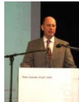
Bundesbauminister Tiefensee bei der Verleihung des „Preis Soziale Stadt 2006“

Die „Vernetzte Sprachförderung und Elternbildung Linden-Süd“ wurde im Rahmen des Bundeswettbewerbs „Preis Soziale Stadt“ mit dem Sonderpreis des Bundesfamilienministeriums ausgezeichnet, eine kleine Delegation u.a. aus Müttern, Gruppenleiterinnen und Mitarbeiterinnen der beteiligten Einrichtungen hat den Preis im Januar 2007 in Berlin in Empfang genommen.