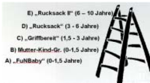
Abb.: Die eingesetzten Elternbildungsprogramme

Während in Hannover das Programm „Rucksack“ bereits in etlichen Kindertagesstätten eingesetzt wird, die anderen Programme dagegen erst langsam den Weg in die Einrichtungen finden, wurde in Linden-Süd (angesichts