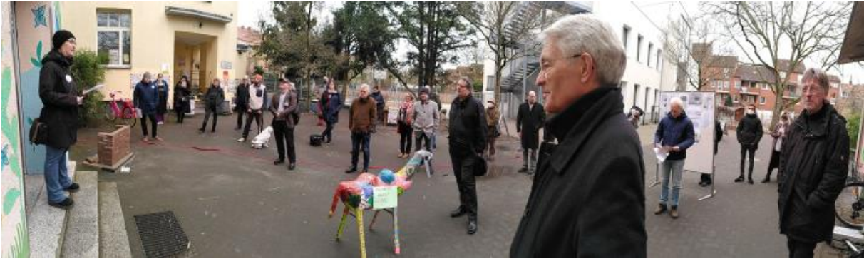
Fotoauswahl; weitere auf Nachfrage; höhere Auflösung s. Anhang; ©RO/STF