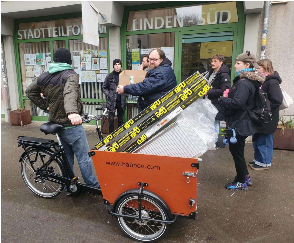
Bilder der Rampen- und Schwellenübergabe im Frühjahr 2026